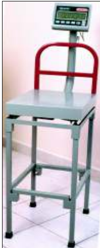
Mesa de 75 cm de alto, de sólida construcción de acero, recubierta de pintura epóxica