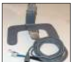
Kit para módulo remoto, incluye soporte mesa pared y extensión