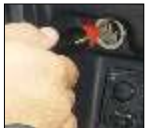
Adaptador para conectar la báscula al encendedor del automóvil.